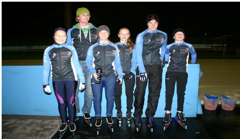
Leden die in Grefath (Duitsland) wedstrijden hebben gereden.